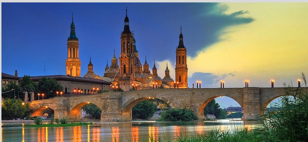
Traumhafte Kulisse für die U22-Europameisterschaften 2014: Das spanische Saragossa.

Spanien hat sich nicht nur durch die drei EuroCup-Endrunden dieses Jahres in Madrid, Getafe und Badajoz in den Fokus des europäischen Rollstuhlbasketballs gespielt, sondern glänzt nach der kurzfristigen Rückgabe durch das italienische Trento nun auch mit der Ausrichtung der IWBF U22 Europameisterschaften 2014 , die nun 1. bis 7. September in Saragossa stattfinden.