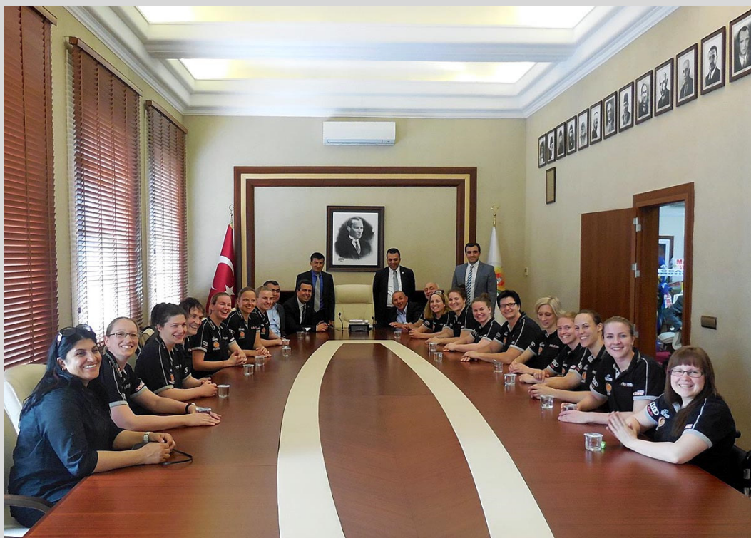
Erfolgreiche und sympathische Botschafter des deutschen Sports: Die deutsche Damen-Nationalmannschaft bei einem Empfang im Rathaus der türkischen Millionenstadt Adana.