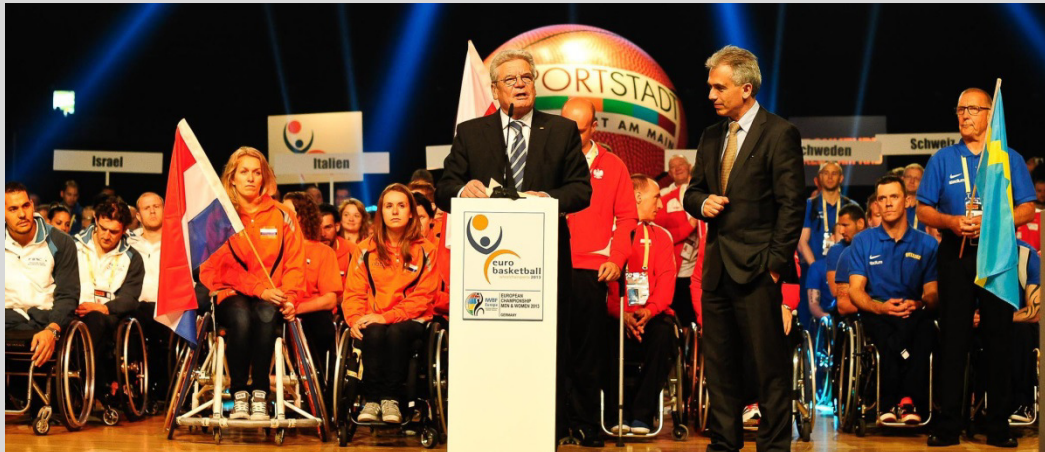
Die niederländischen Damen (li.) und die schwedischen Herren (re.) sind während des World Super Cup erneut Gast in Frankfurt am Main.

Der neu geschaffene World Super Cup in Frankfurt am Main bringt ein Jahr nach der Eurobasketball erneut EM-Flair in die Bankenmetropole. Vom 6. bis 8. Juni empfängt das Team Germany bei den Damen die Kanada und die Niederlande und bei den Herren Schweden und die Türkei in der Franz-Böhm-Sporthalle, der Heimstätte der Mainhatten Skywheelers.