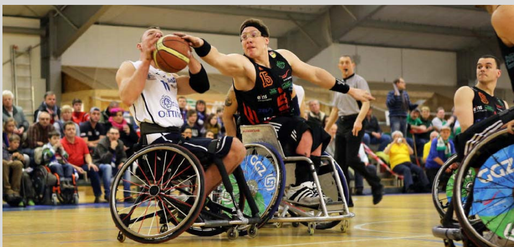
Halbfinalknaller zwischen Thüringen und Zwickau. Der Meister von 2002 und 2008 aus Sachsen setzte sich in drei Spielen gegen den Konkurrenten aus Elxleben durch.

Nach 90 Spielen in der Hauptrunde der RBBL, einem spannenden Playoff-Halbfinale folgt nun am 6., 12. und optional am 13. April der Showdown um den Titel 2014. Dabei kommt es in der „best-of-three“ Finalserie zum Klassiker der beiden alten Rivalen RSC-Rollis Zwickau und RSV Lahn-Dill. Spiel eins dieser mit Spannung erwarteten Serie steigt bereits am kommenden Sonntag auf dem Zwickauer Scheffelberg, während Spiel zwei und ein eventuell drittes notwendiges Finale im hessischen Wetzlar stattfinden. Bereits jetzt ist das Interesse an der diesjährigen Meisterschaftsentscheidung riesig, das ZDF wie auch Sky haben bereits ihr Kommen für Spiel zwei angekündigt, in dem die Entscheidung bereits für einen der beiden Kontrahenten fallen kann: www.rbbl.de .