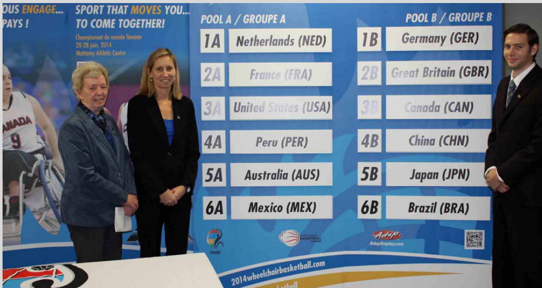
Auslosung der Vorrundengruppen in Toronto.