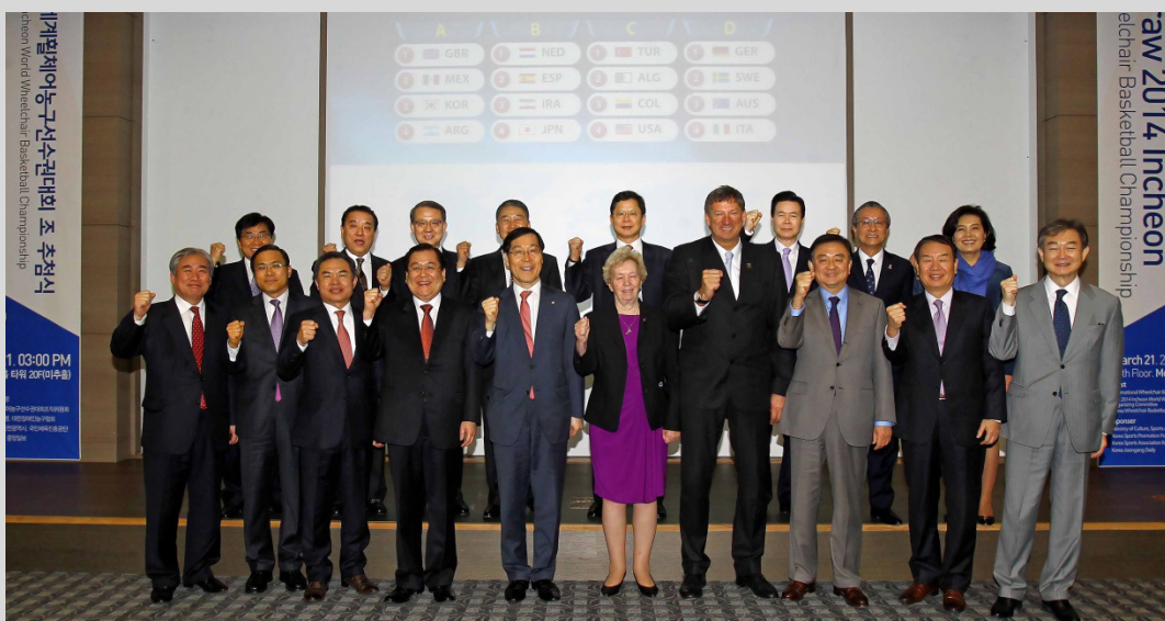
Gruppenauslosung im Songdo Techno Park von Incheon.